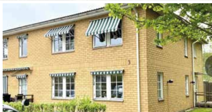
SoL 7.1.3 Psykiatri

VINKELGATAN – psykiatri, våldsutsatthet och samsjuklighet. Mindre boende med 7 platser i egna lägenheter. För kvinnor, 21–65 år.