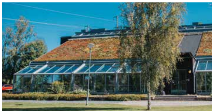
SoL 7.1.3 Psykiatrisk behandling och habilitering

EKOTOPIA – i hjärtat av Småland välkomnar vi kvinnor och män, 21–55 år, med psykiatriska funktionsvariationer och missbruksproblematik.