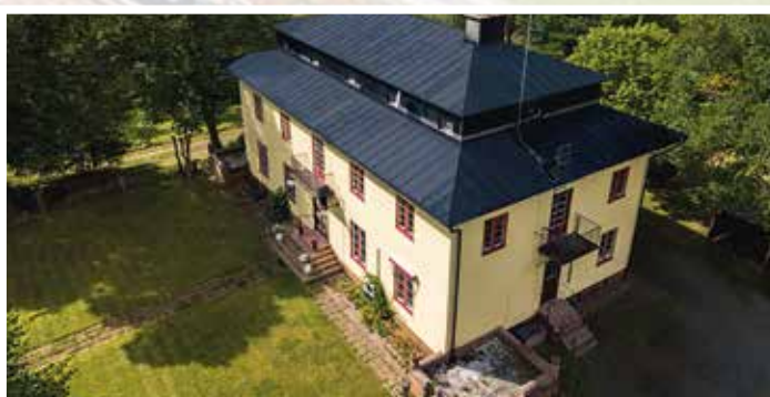
SoL 7.1.1 Missbruksbehandling

ROBBIN HVB – boende (även akutboende) och behandling för kvinnor eller män, 21–65 år i utsatta situationer och miljöer med missbruks- och beroendeproblematik. Trauma och våldsutsatthet till följd av missbruk samt sidoproblematik som avser psykisk ohälsa.